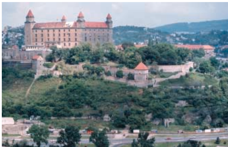
Castello di Bratislava